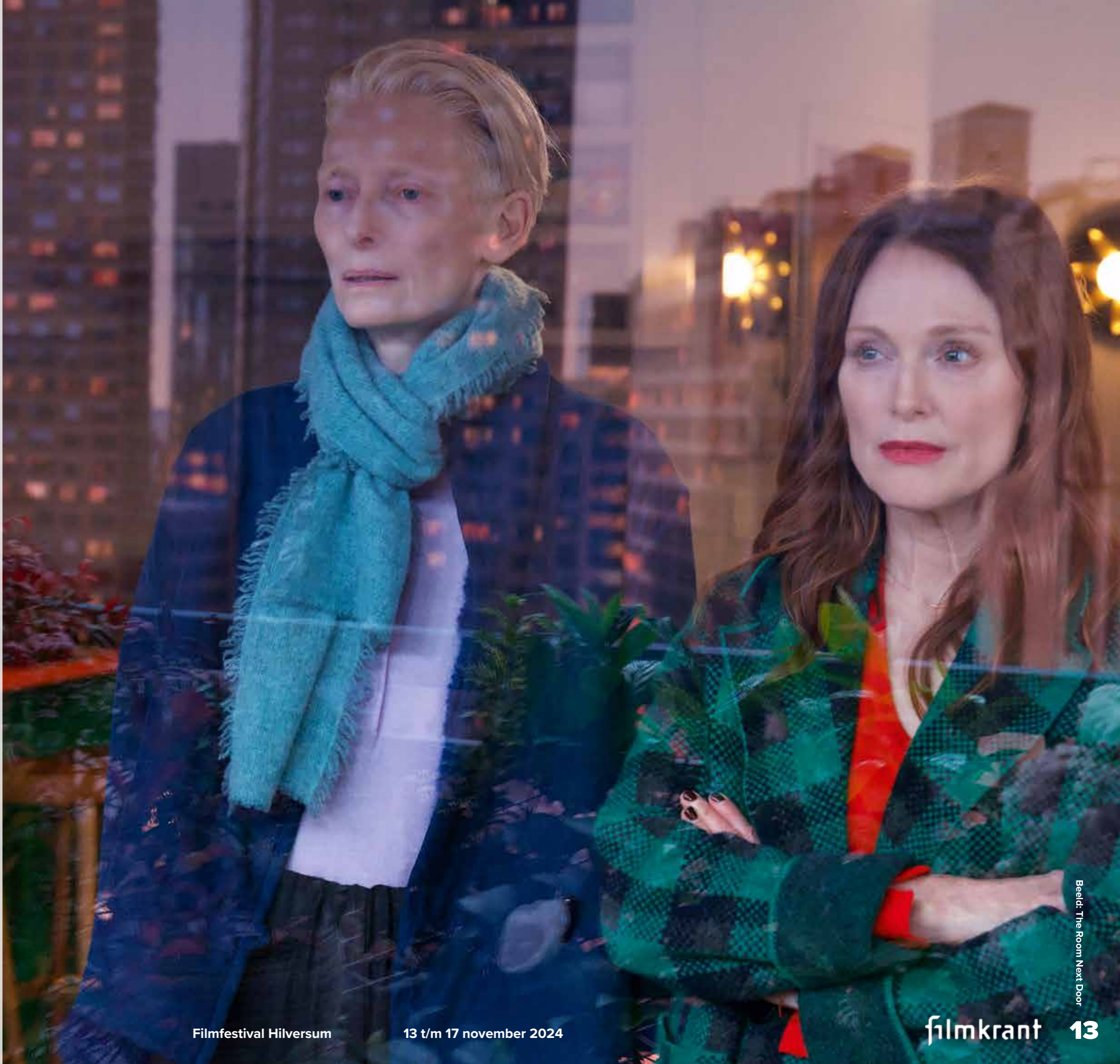
Beeld: The Room Next Door